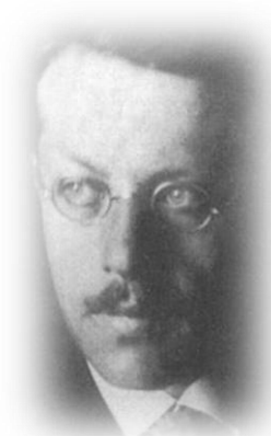
Franz Rosenzweig, Begründer des freien Jüdischen Lehrhauses, 1920

Jüdisches Lehrhaus Göttingen e.V., Postfach 2345, 37013 Göttingen, 0551 -6 33 94 15; Konto: 11 88 28 bei SK Göttingen (BLZ 260 500 01)